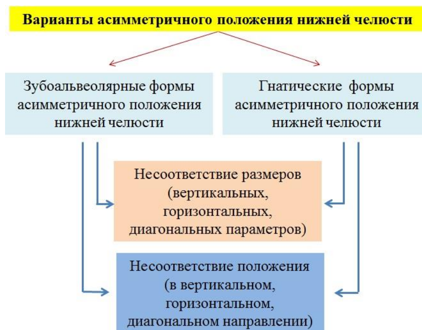
Рисунок 2 – Варианты асимметрии нижней челюсти

Результаты исследования пациентов с асимметричным положением нижней челюсти и сравнение данных с пациентами, имеющими физиологическую окклюзию, показали, что наиболее часто встречаются две основные разновидности асимметричного положения нижней челюсти: зубоальвеолярная и гнатическая (рисунок 2).