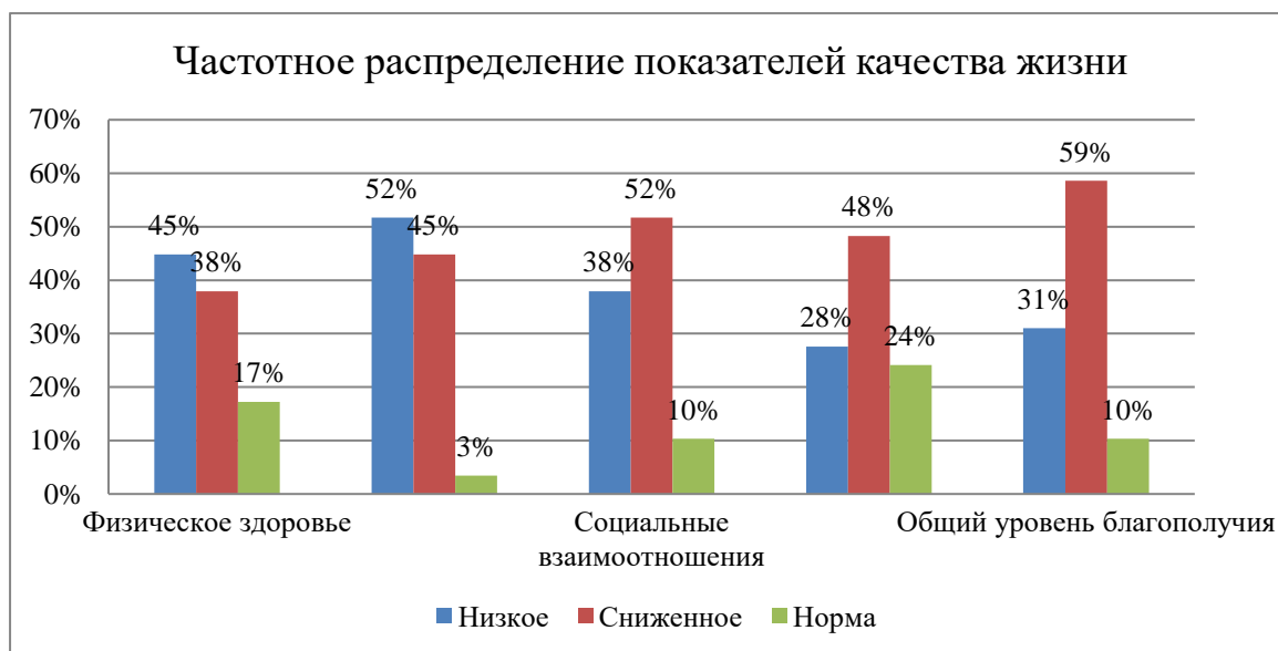
Рисунок 2. Диаграмма показателей качества жизни (физическое и психологическое благополучие, самовосприятие, микросоциальная поддержка и социальное благополучие), а также общий уровень благополучия у группы людей с отторжением ранее установленных дентальных имплантатов в возрасте 65 лет и старше, с сопутствующей соматической патологией.

низкой у 28%, сниженной у 48%, а норма значения этого показателя определялась у 24% респондентов.