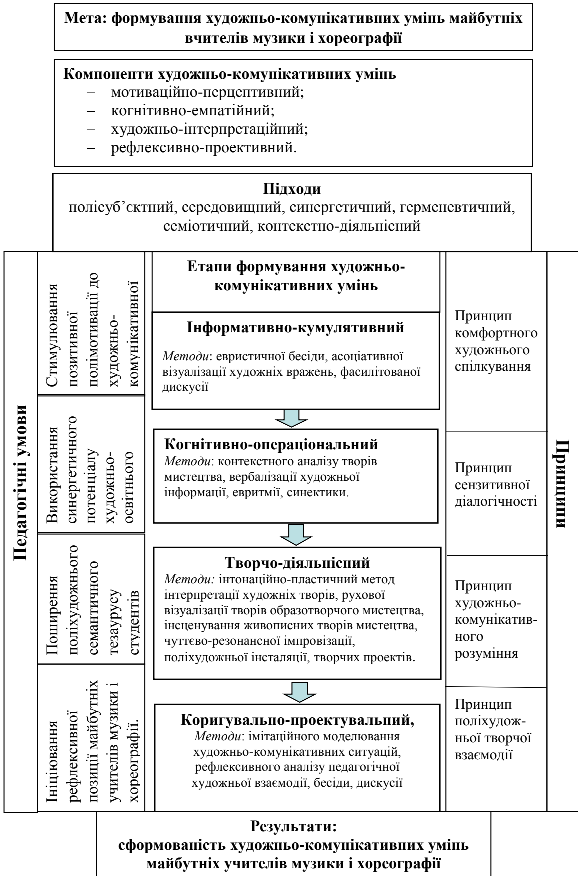
Рис. 1. Організаційно-методична модель формування художньо-комунікативних умінь майбутніх учителів музики і хореографії