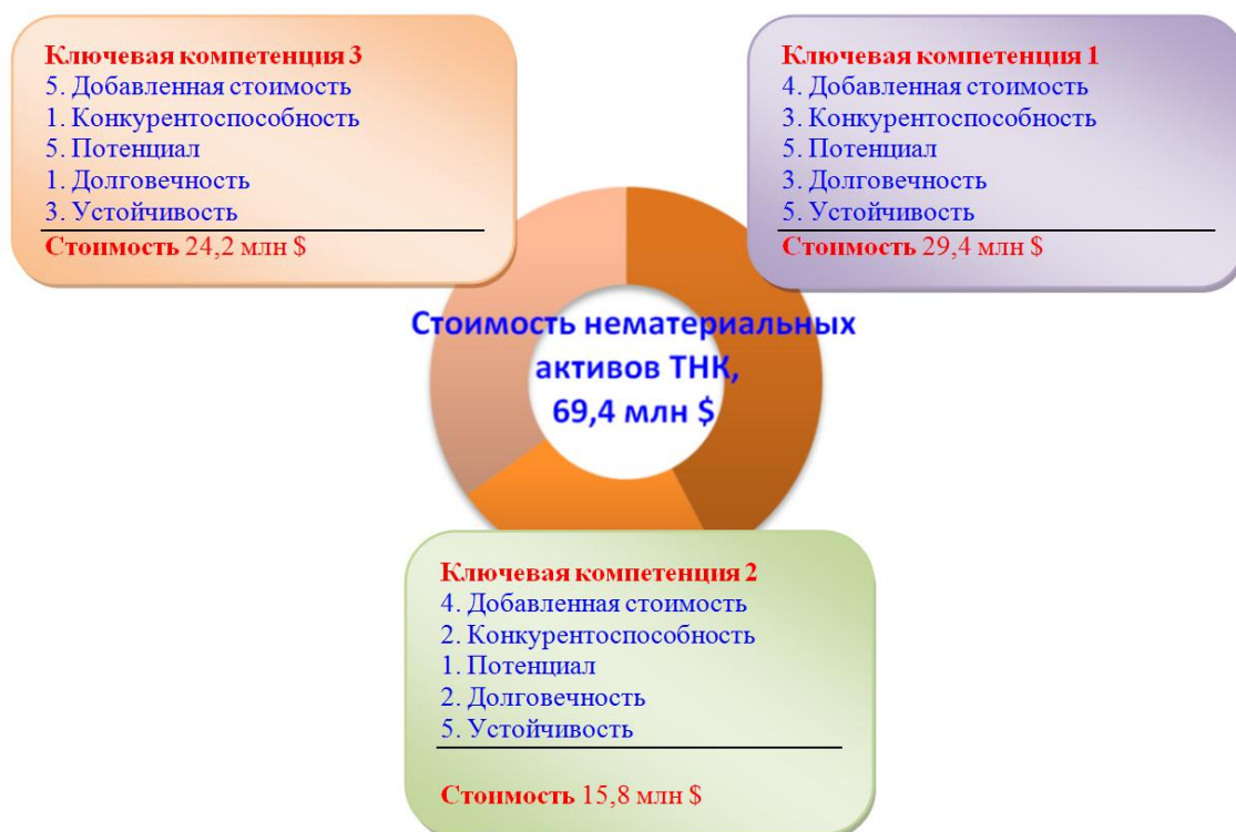
Рисунок 8. Пример стоимостной диаграммы для «Вэлью Иксплорэ» («КПМГ»)

Для измерения результативности управления знаниями на каждой стадии проекта можно использовать модель «Интел Копрэйшн Модл»; также автором рассмотрены основные показатели результативности функционирования элементов среды управления знаниями и проанализированы индикаторы общей результативности управления знаниями, применяемые в ТНК «КПМГ», ТНК «Хьюлетт-Паккард», ТНК «Шлумбергер», ТНК «Сименс» и ТНК «Ксерокс».