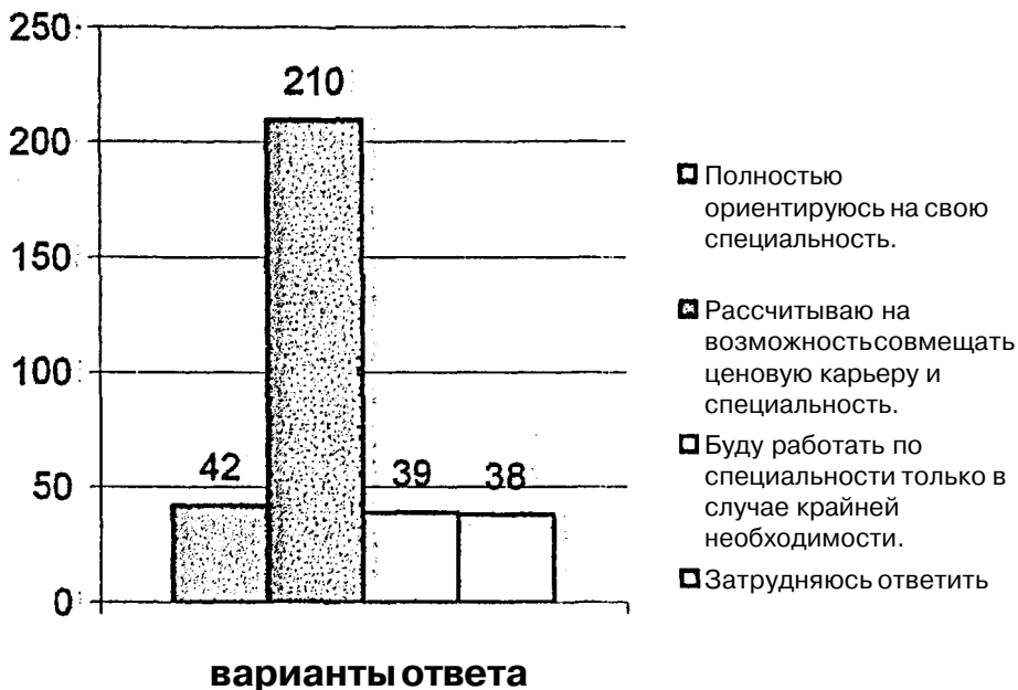
Рис 1 Стратегии профессиональной карьеры

Отношение к получаемой профессии меняется в зависимости от диспозиции конкретной части студенчества, от ориентации на взрослость, «догоняющего» или «аутистского» стилей жизни. Приведенное в ЮРГТУ (НПИ) исследование, выявило, что на характер восприятия, оценки и склонности к профессиональной социализации существенно влияет не только модель принуждения или «безальтернативного» выбора, предлагаемая студентами в процессе профессиональной социализации, но и профессиональная стратегия студентов, связанная с поведенческими образцами и стилем жизни.