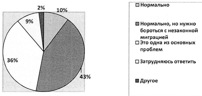
Диаграмма 1. Отношение жителей к увеличению многонациональности на территории города Одинцово. (в % от количества опрошенных)

В месте с тем москвичи за последние два года стали относиться с большим сочувствием и пониманием их востребованности.