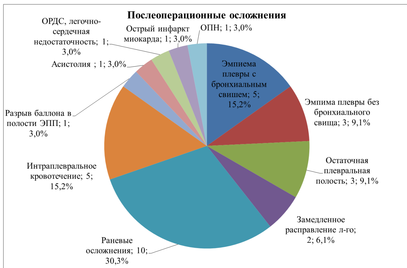
Рисунок 1. Распределение по видам послеоперационных осложнений

Более редкое (в 3,1 раза) развитие бронхоплевральных осложнений у пациентов 2 группы было связано в первую очередь с измененной методикой ведения плевральной полости.