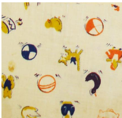
Рис.19. Ситец. П.Н.Прыткова, 1958