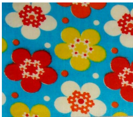
Рис. 3. Ситец. Н.А. Гузикова, 1974

- растительный орнамент разнообразен в своей трактовке и изобразительном решении и делится на три основных вида: упрощенные и геометризированные цветочные рисунки (Рис.3), образно-реалистическая трактовка мотивов с включением разнообразных художественных приемов (Рис.4) и традиционное исполнение цветочного орнамента с ясной моделировкой объема (Рис.5);