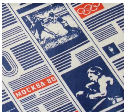
Рис.13. Ситец. Неизвестный автор, 1979