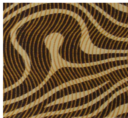
Рис. 8. Штапельное полотно. К.С. Логинов, 1960

В подразделе 2.2 «Хронологическая сравнительная линейка орнаментальных мотивов ивановских набивных тканей второй половины XX века» рассмотрены особенности художественного проектирования всех групп текстильного орнамента разных временных отрезков второй половины XX века, исследовано композиционное построение рисунка, характер его орнаментальных форм и основные стилеобразующие принципы.