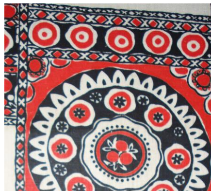
Рис.11. Бязь. Т.А. Терентьева, 1967

В подразделе 2.4 «Творческие эксперименты ивановских художников в процессе поиска оригинальных решений оформления текстиля» отмечены основные новаторские идеи ивановских художников в процессе поиска оригинальных способов украшения текстиля исследуемого периода. Это: