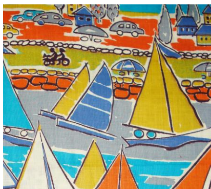
Рис.6. Ситец. Неизвестный автор, 1961

- беспредметный орнамент, включающий ассоциативные рисунки, имитирующие природные состояния, поверхности материалов, художественные техники, шрифтовые рисунки и т.д.(Рис.8).