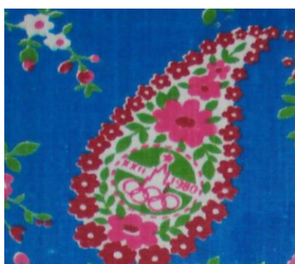
Рис.12. Ситец. С.Н. Казарцева, 1978