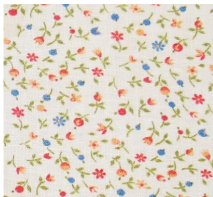
Рис.10. Ситец. А.А. Заикина, 1984