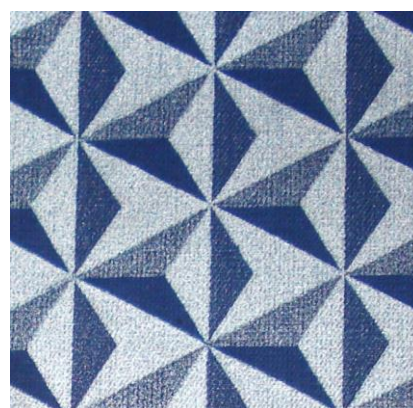
Рис. 20. Штапельное полотно. Неизвестный автор, 1989

Основные стилеобразующие приемы творческой работы ивановских художников БИМ второй половины XX века – использование бесконтурных узоров, тонкие линейные рисунки, комбинирующиеся с различными