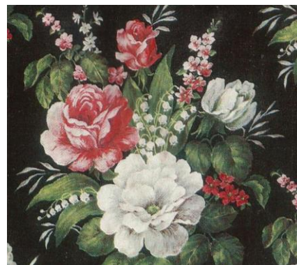
Рис.5. Рисунок на сатин. Е.И. Мигунова, 1973

- геометрический орнамент, состоящий из простых форм (горох, полосы, квадраты), которые свободно масштабируются и комбинируются в зависимости от фактуры и назначения ткани;