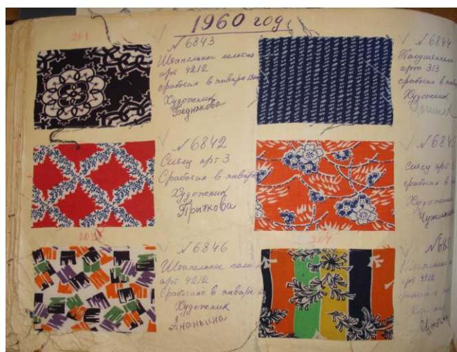
Рис. 2. Разворот каталога с выклейками тканей БИМ, 1960

Обнаруженные рабочие каталоги представляли собой альбомы из плотной бумаги, образцы или эскизы тканей в которых были сгруппированы в таблицы, и содержали серийный номер рисунка, информацию о дате выпуска, авторе, оценке художественного совета и т.п. Коллекции текстильных образцов состояли из отрезков тканей, производимых БИМ и Ивановским хлопчатобумажным комбинатом им. Ф. Н. Самойлова в период 1960-1980 гг., которые были собраны в комплекты по датам выпуска.