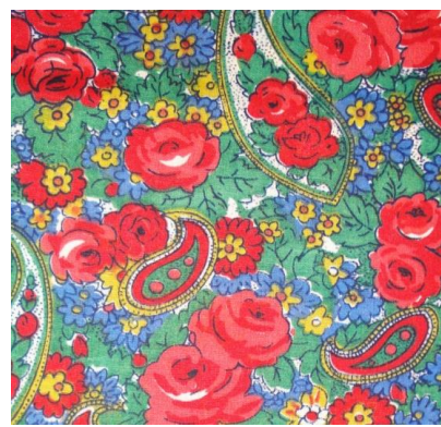
Рис. 17. Штапельное полотно. Т.М. Коптякова, 1967