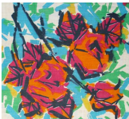
Рис. 4. Ситец. Неизвестный автор, 1961