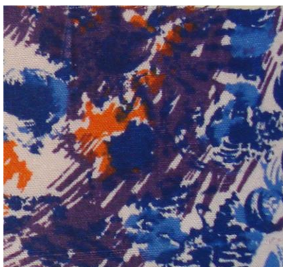
Рис.7. Штапельное полотно. П.Н. Прыткова, 1959