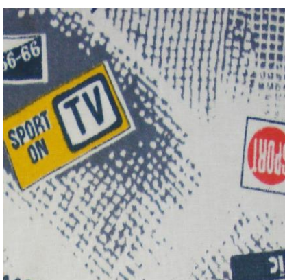
Рис.18. Бязь. Неизвестный автор, 1989

- заимствование западных тенденций в оформлении текстиля, в частности использование декоративных элементов стиля поп-арт - изображений объектов массовой культуры и предметов быта (помады, флаконы духов и прочее). В геометрическом орнаменте встречались элементы стиля оп-арт (Рис.20).