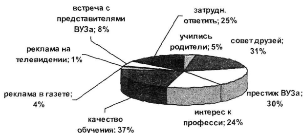
Рис 1. Параметры, влияющие на выбор учебного заведения.

Диссертантом в 2006-м году было проведено исследование, определяющее основные характеристики потенциальных потребителей рынка образовательных услуг г. Ялуторовска, в результате которого было опрошено 887 учащихся школ и средних специальных заведений. По результатам исследования можно определить, что основополагающими при выборе учебного заведения является качество получаемого образования, престиж вуза и рекомендации сверстников (рис.1.).