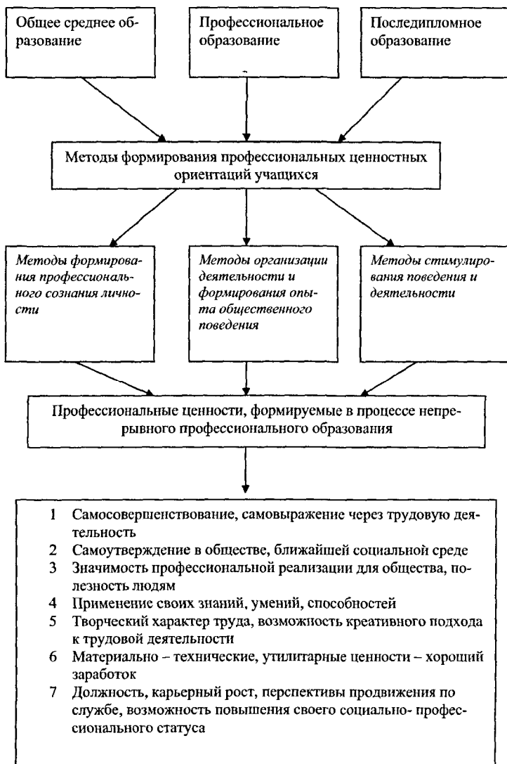
Рис 4 Профессиональные ценности, формируемые в процессе непрерывного профессионального образования

Анализ проведенного исследования, дал диссертанту возможность разработать социокультурную модель формирования профессиональных ценностных ориентаций в процессе непрерывного профессионального образования (рис 5)