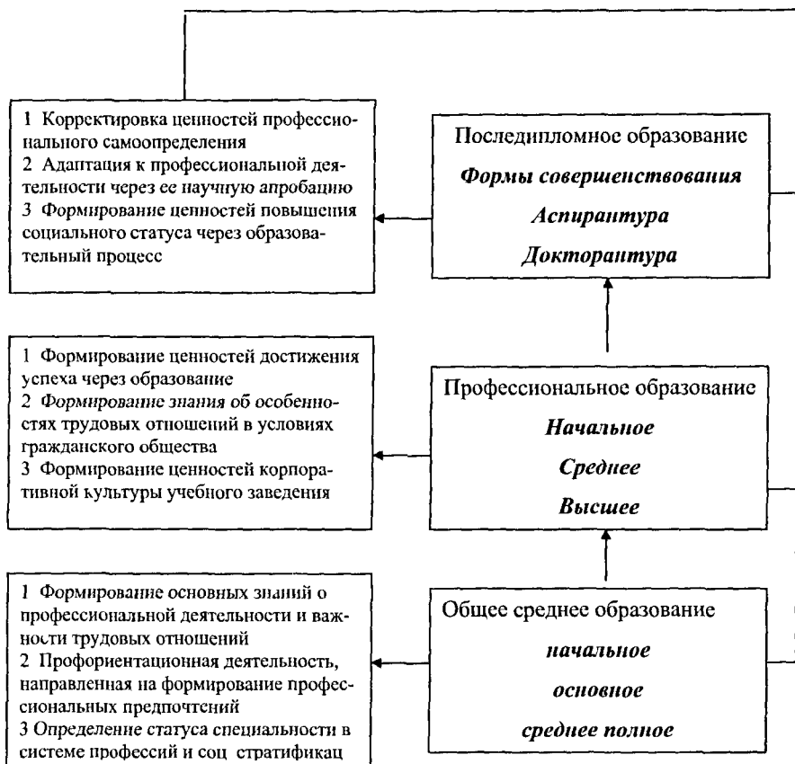
Рис 5 Социокультурная модель влияния непрерывного профессионального образования на формирование профессиональных ценностных ориентаций учащейся молодежи

Механизм социокультурного регулирования профессиональных ценностных ориентаций, по мнению автора данного исследования, должен реализовываться по следующим этапам