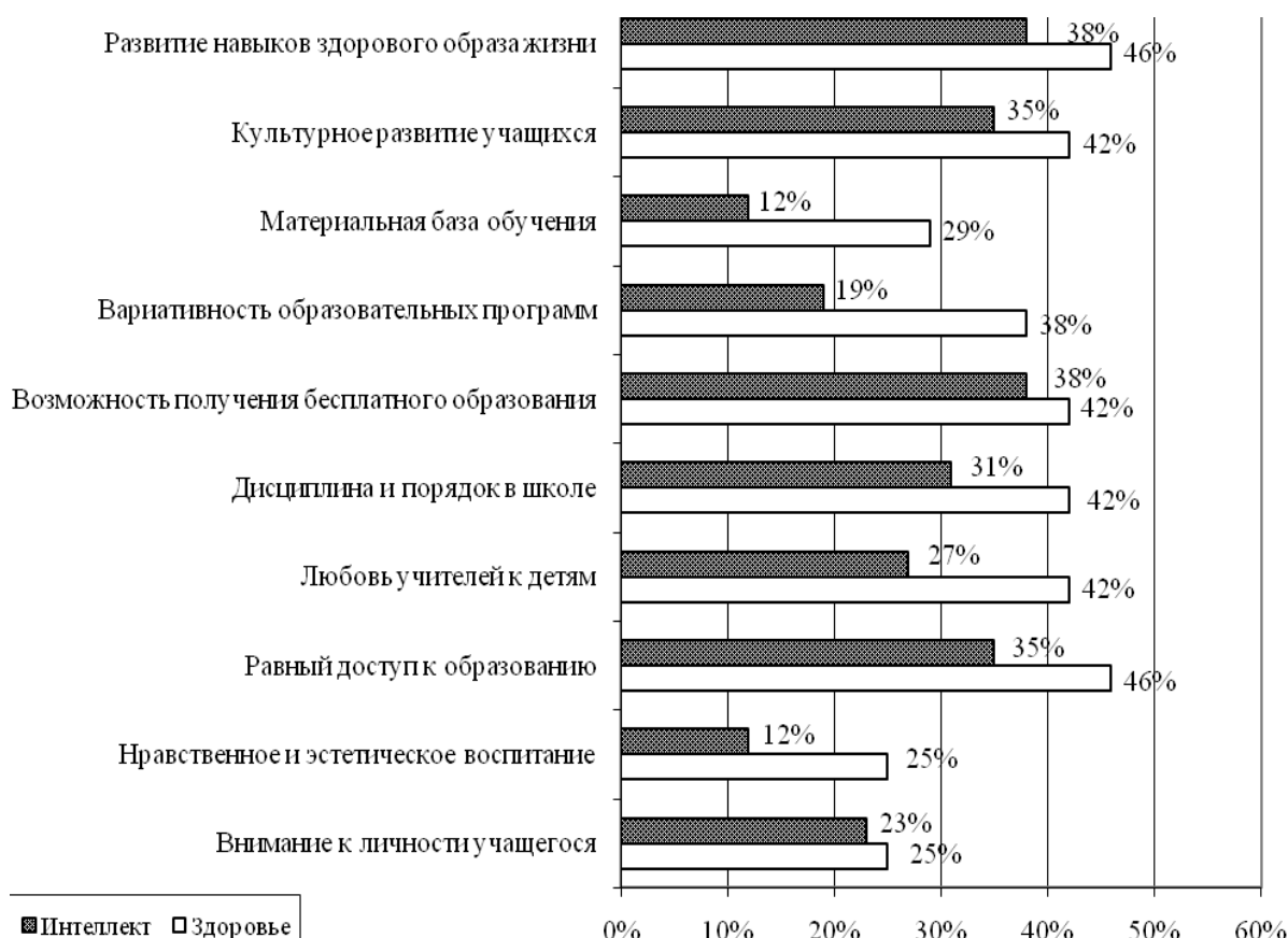
Рис. 1. Характеристики установок родителей, ориентированных на здоровье и на интеллект

Вторая типология родительских установок основана на позиции родителей относительно проективной модели системы образования страны. В этой типологии родители выделяли различные доминанты в системе образования: развитие интеллекта, сохранение здоровья ребенка, ориентация на европейскую модель или на советскую модель. Родители, ориентированные на поддержание здоровья ребенка, позитивнее родителей, ориентирующихся на развитие интеллекта, оценили равный доступ к образованию, любовь учителей к детям, вариативность обучения (рис. 1).