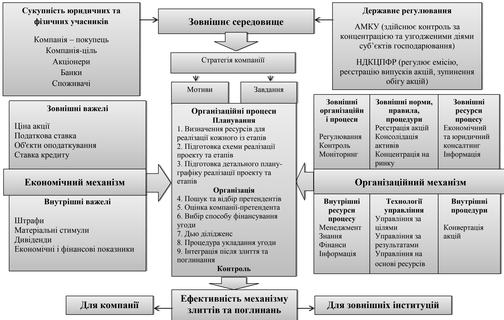
Рис. 1. Модель організаційно-економічного механізму реалізації процесів злиття та поглинання компаній у національній економіці