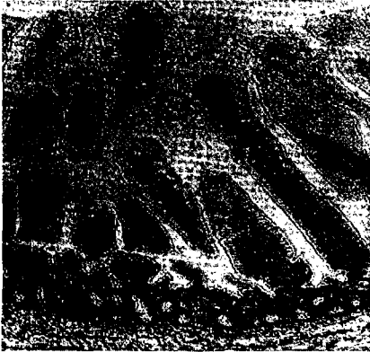
Рисунок 1. Микрофотография гистосреза подвздошной кишки 2-х дневного котёнка, заражённого алиментарным путём цистами токсоплазм «3». Набухание ворсинок в слизистой оболочке. Дистрофия покровного эпителия, ворсинки с признаками развивающегося некролиза. Окраска гематоксилином-эозином. Увеличение 1:400.