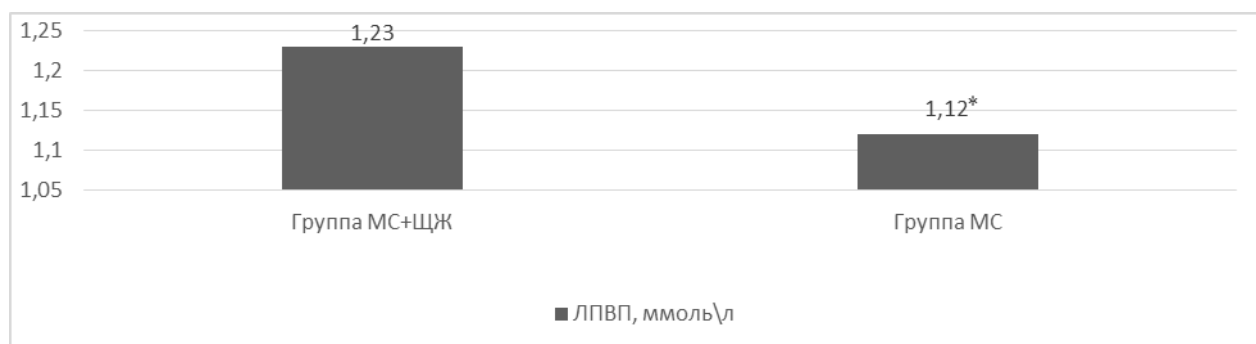
Рис. 2. Характеристика показателей липидного спектра в исследуемых группах (Группа МС+ЩЖ; Группа МС).

Таким образом, при оценке показателей уровня инсулина, индекса НОМА – IR, липидного спектра у пациентов только с МС нарастали явления ИР и атерогенной дислипидемии в сравнении с больными с коморбидностью, и только с патологией ЩЖ. В связи с этим была проанализирована применяемая фармакотерапия в исследуемых группах. В результате оценки, проводимых видов фармакотерапии (антигипертензивная, антиагрегантная, антиангинальная, сахароснижающая, гиполипидемическая, гормоны ЩЖ и тиреостатики) было выявлено, что в группе пациентов с коморбидностью МС и патологии ЩЖ в отличие от группы только с МС, антиагрегантная терапия проводилась у 100 % ( p=0,01 , 30\30) пациентов, гиполипидемическая терапия у 63,3% ( p=0,016 , 16\30) пациентов. Таким образом, в группе больных с коморбидным течением МС и патологии ЩЖ фармакотерапия имела более интенсивный характер и являлась комплексной, чем, по-видимому и объясняются полученные лучшие результаты метаболических показателей. Также это может быть обусловлено и дизайном – поперечное исследование.