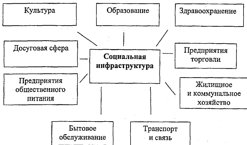
Рис. 1. Классификация социальной инфраструктуры по отраслевому принципу

внутреннего содержания и структуры, но и на разработку практических мероприятий по развитию и совершенствованию объектов социальной сферы.