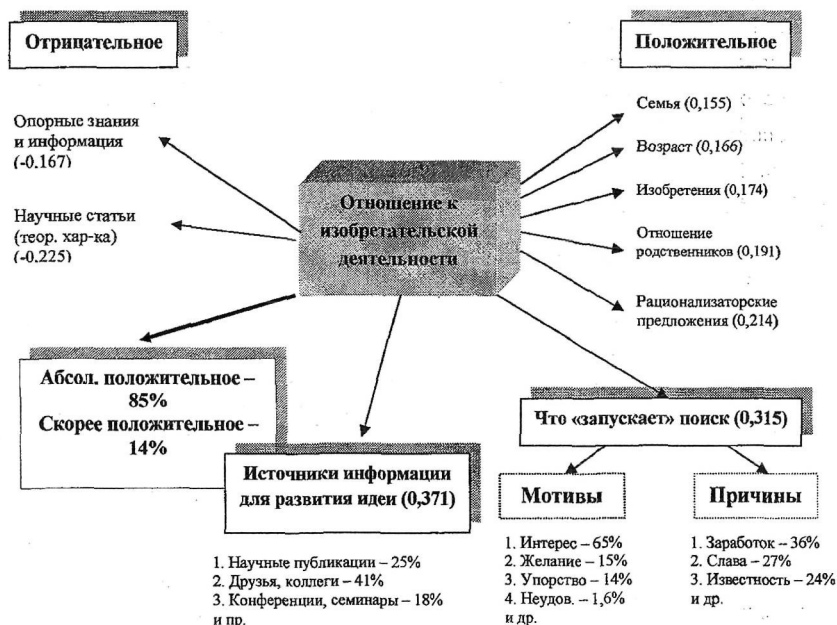
Рис. 1. Схема причинных связей по отношению к изобретательской деятельности.

Общее мнение экспертов сводилось к тому, что в России научная работа держится только на энтузиазме изобретателей, при этом несовершенство российского законодательства существенно тормозит научный процесс. В силу низкого социального престижа научной деятельности молодежь мало интересуется научными исследованиями и разработками, поэтому преемственность научного потенциала страны находится под угрозой.