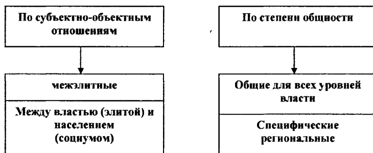
Рисунок 1 — Классификация социальных механизмов властеотношений в регионе

В диссертации предлагается авторская классификация механизмов отношений власти на региональном уровне. Данные механизмы рассматриваются, во-первых, по их положению в структуре субъектно-объектных связей, во-вторых, по степени общности. По первому основанию различаются механизмы организации правящей региональной элиты и механизмы ее отношений с местным социумом (отношений политического субъекта с объектом властного воздействия). По второму основанию выделяются общие и специфические (региональные) механизмы осуществления власти (рисунок 1).