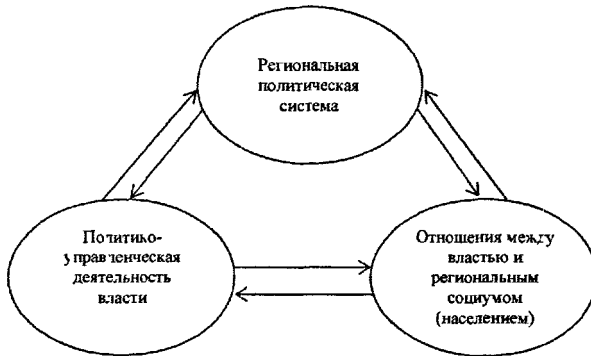
Рисунок 3 — Структура механизма социально-политической ответственности на региональном уровне.

Особо отметим, что в структуре эффективного механизма ответственности, прежде всего, предполагается наличие системы политической организации регионального социума. Этот аспект означает дифференцированность власти в обществе, т. е. участие различных групп в ее осуществлении, степень представленности и учета их разнообразных политических позиций. При этом жизненно важным является вопрос обеспечения свободного выражения мнений, оценок всеми акторами властных отношений в регионе. Механизм социальной ответственности предполагает наличие общественного контроля над властью, широкое участие регионального сообщества в политической жизни.