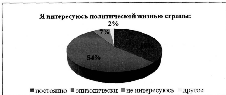
Результаты социологического исследования «Особенности политической социализации современной молодежи России». Вопрос 7

Также в рамках диссертационного исследования было установлено, что: