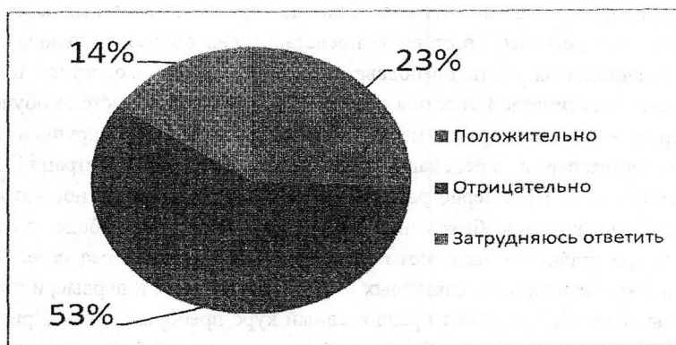
Рис. 2. Оценка студентами разделения образовательного процесса на две ступени – бакалавриат и магистратура

Студенты также в большей степени отрицательно оценивают данное нововведение (рис. 2).