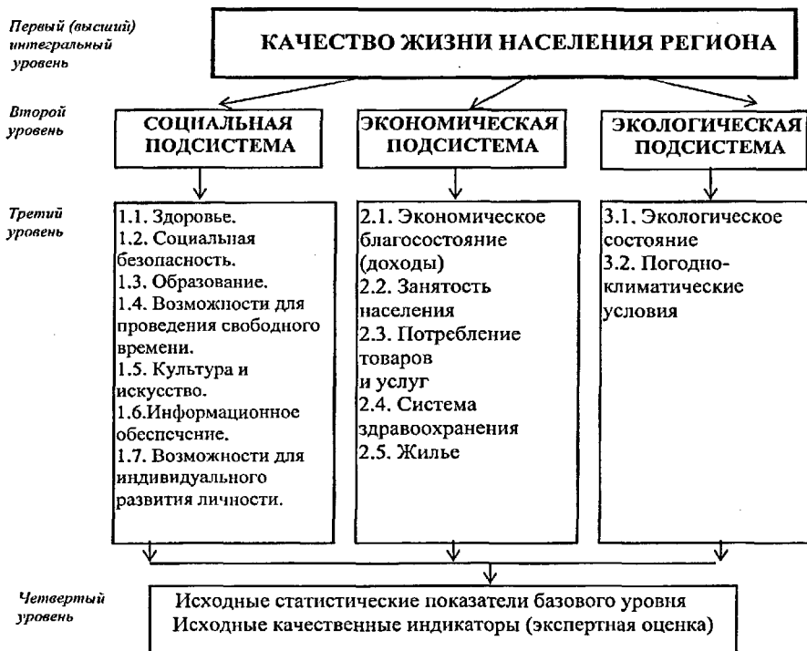
Рис. 1. Иерархическая система качества жизни населения региона

На основании вышезложенных подходов сформирована иерархическая система, приемлемая для проведения мониторинга и прогнозирования территориальной дифференциации качества жизни населения региона (рис. 1).