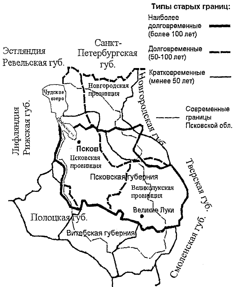
Рисунок 2 – Интегральная типология исторических и современных границ Псковского региона (старые границы)

Интегральная типология современных и исторических границ позволяет учитывать как давность происхождения, так и длительность их существования (рис. 2, 3):