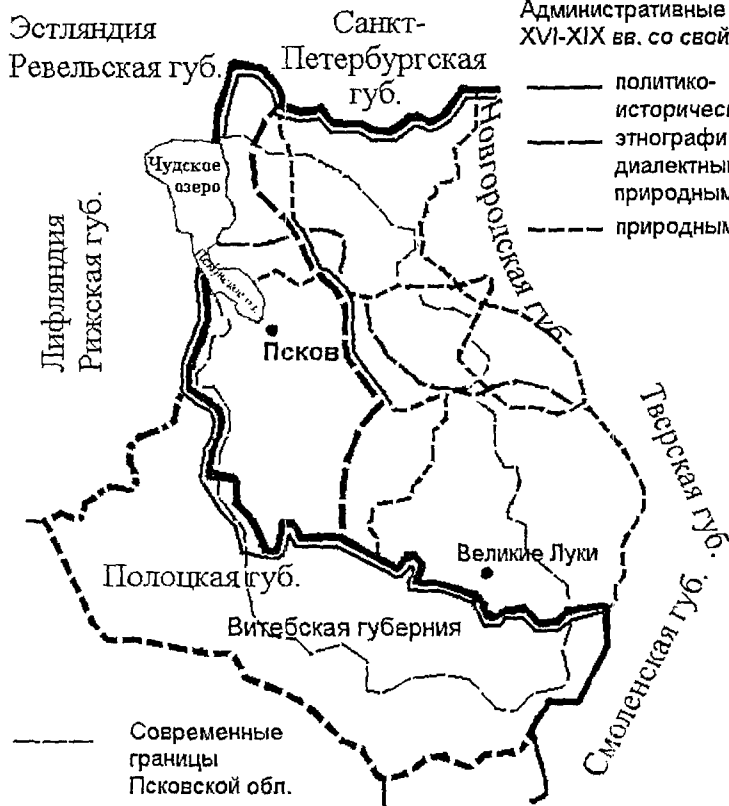
Рисунок 4 – Свойства политических и административных границ Псковского региона XIII–XIX вв.