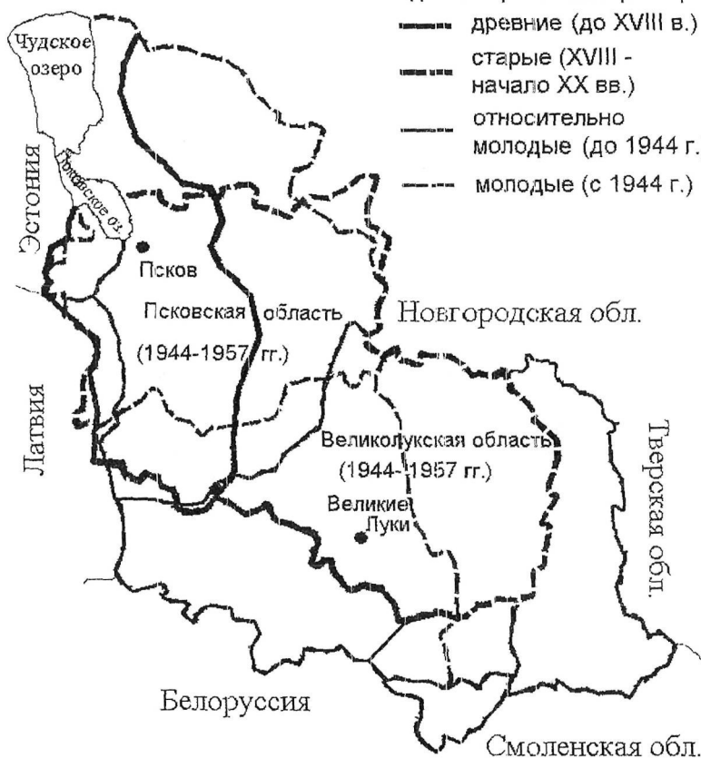
Рисунок 1 – Давность происхождения политических и административных границ Псковского региона