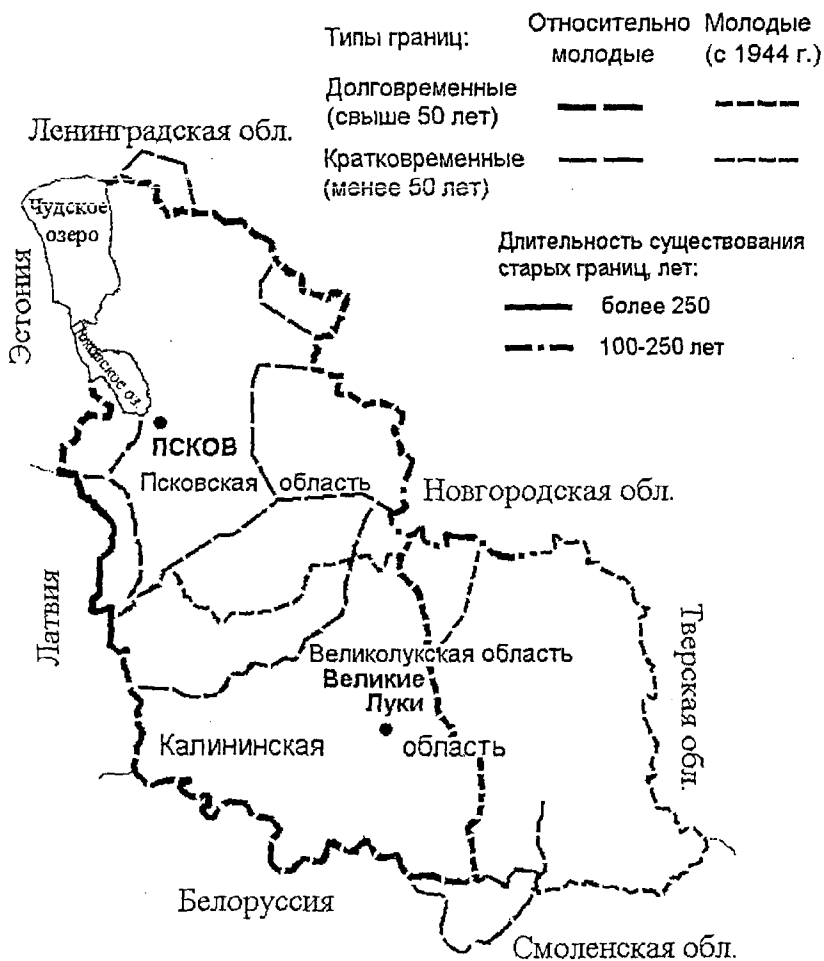
Рисунок 3 – Интегральная типология исторических и современных границ Псковского региона (молодые границы)