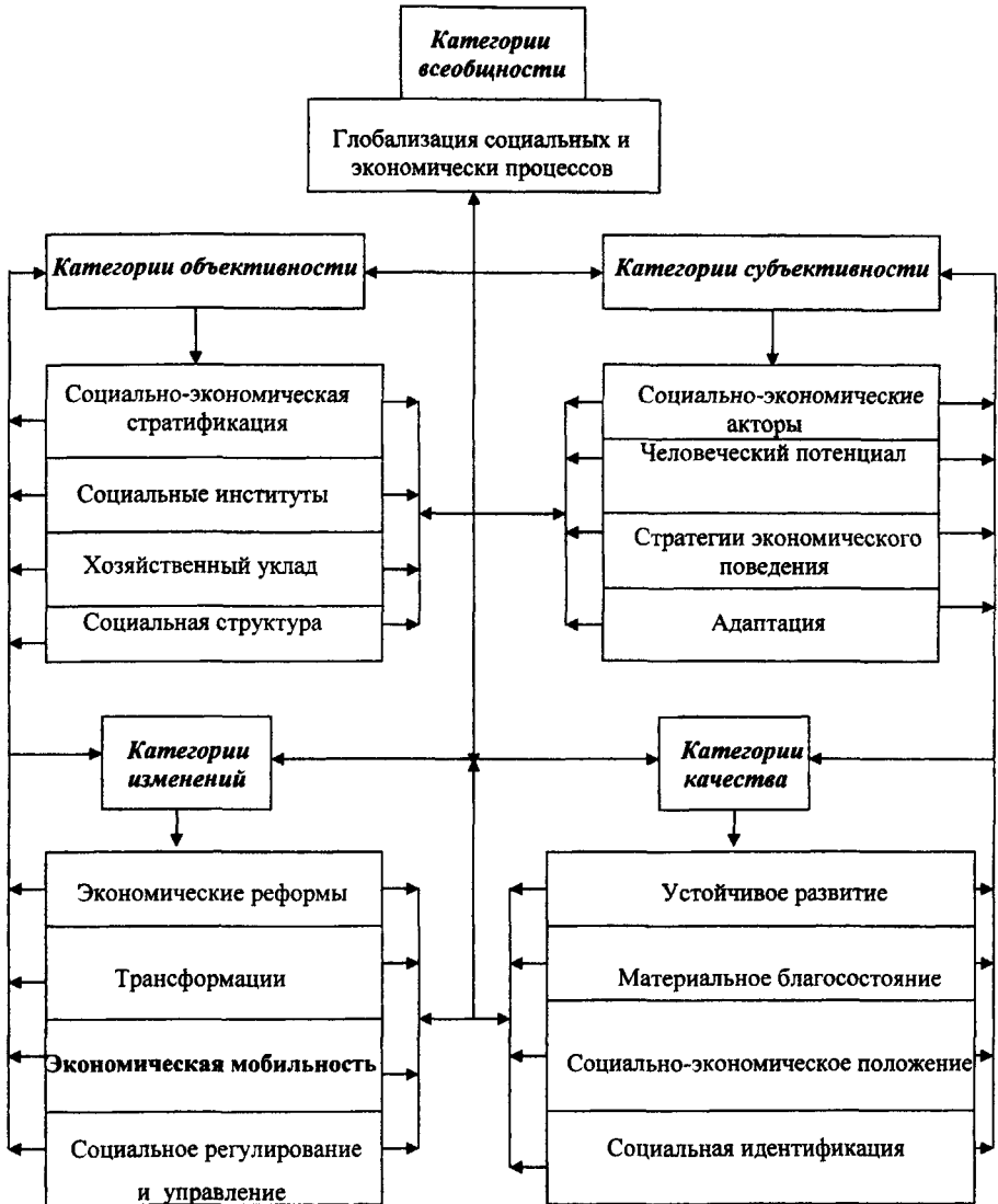
Рис. 1. Экономическая мобильность в системе категорий социальной статистики и динамики