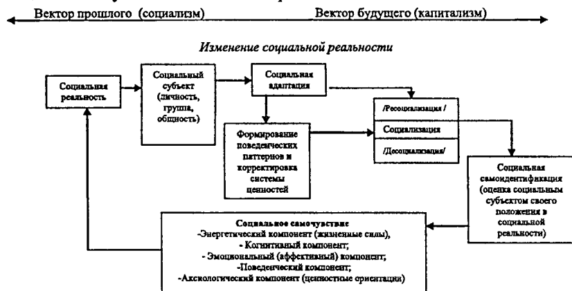
Схема 2 Блок-схема факторной модели социального самочувствия в условиях изменяющегося общества

ния установок социального субъекта по отношению к существующим нормам и ценностям) и формирование определенного социального паттерна, оказывающие влияние на оценку социальным субъектом своего положения в социуме. Данный процесс обуславливает характер социального самочувствия и мотивацию социальных действий, а также самоидентификацию социального субъекта в социальной реальности.