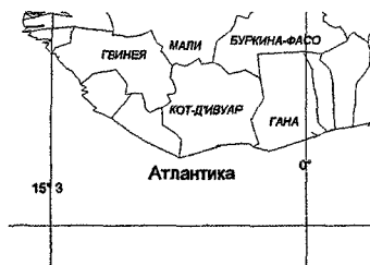
Рисунок 1 - Карта Западной Африки

Кот-д'Ивуар, находящийся в Западной Африке, располагается на побережье Гвинейского залива. На территории Кот-д'Ивуара выпадает сравнительно значительное количество осадков. Режим увлажнения характеризуется большой межгодовой изменчивостью. Актуальна задача долгосрочного прогноза месячных и сезонных сумм осадков. Эффективное прогнозирование осадков на территории позволит более рационально планировать и осуществлять сельскохозяйственные производства и другие виды хозяйственной деятельности.