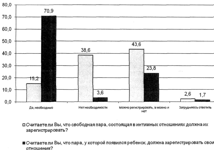
Рис. 1. Оценка необходимости регистрации отношений, %

В целом поддерживая официальный брак, общество не возражает против легитимации «гражданского брака». В сущности, предпринимается попытка основать новую легитимную форму отношений между мужчиной и женщиной, которая может рассматриваться как попытка вывести личную жизнь индивидов из-под контроля государства. Исследование показывает, что само общество рассматривает «гражданский брак» как форму отношений мужчины и женщины. По мнению большинства, с появлением ребенка такие отношения необходимо оформлять (рис. 1). Это опровергает распространенное мнение о том, что такие отношения можно считать семьей.