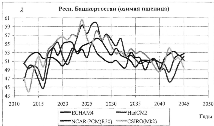
Рис. 3. Сглаженная динамика относительных потерь урожайности, полученная по данным климатических сценариев.

Башкортостан, рассчитанная по четырем климатическим сценариям (ECHAM4, NCAR-PCM(R30), HadCM3 и CSIRO(Mk2)), хорошо согласующимся между собой. На этих графиках отмечается период 2020—2030гг, когда могут наблюдаться более частые засушливые явления. Менее частыми они станут в последующие годы.