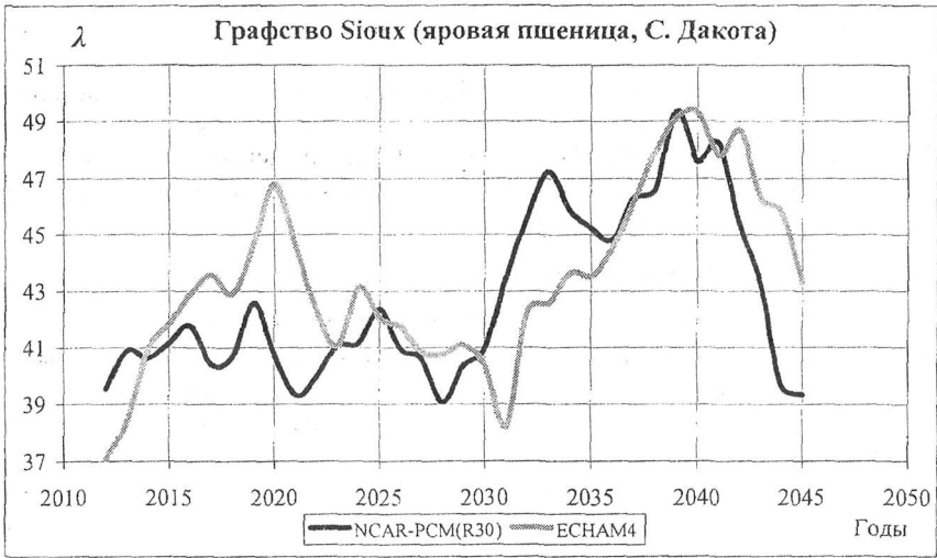
Рис. 1. Сглаженная динамика относительных потерь урожайности, полученная по данным климатических сценариев.