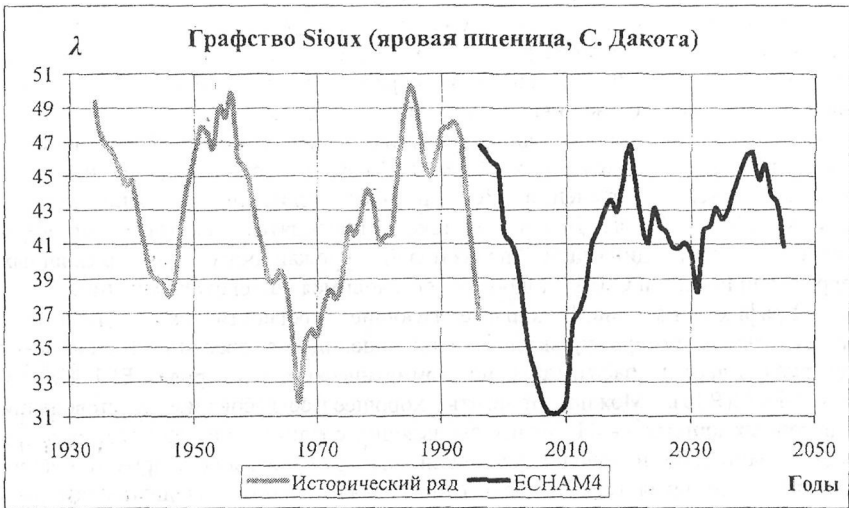
Рис. 2. Пример сравнения исторической и прогностической сглаженной динамики показателей урожайности.

Интересные результаты получены при проведении прогностических расчетов для регионов России. На рис. 3 показана сглаженная прогностическая динамика относительных потерь урожайности озимой пшеницы в республике