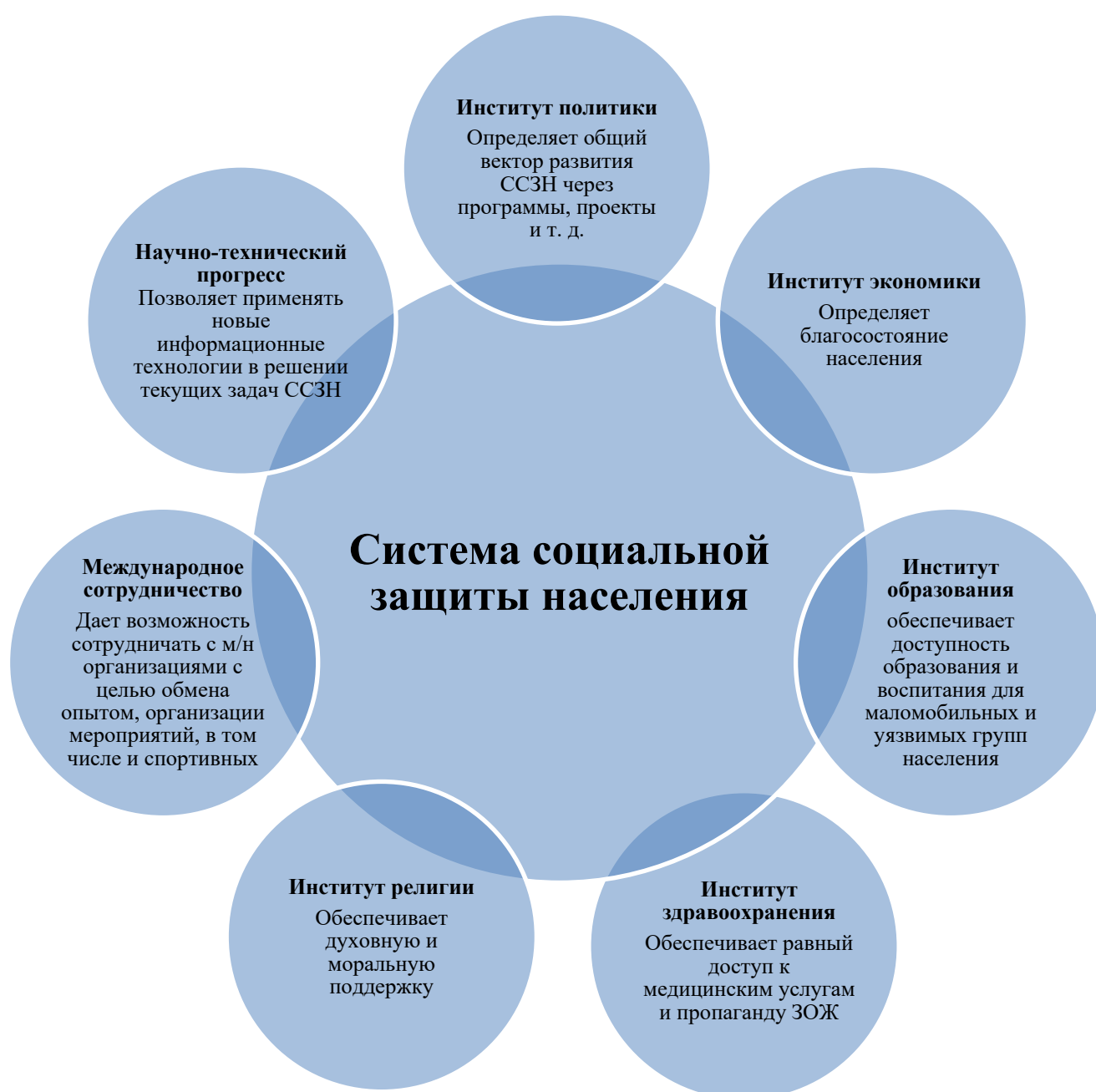
Рисунок 2. Взаимодействие системы социальной защиты населения с институтами

В первом параграфе «Институты, влияющие на социальную защиту населения» диссертант раскрывает влияние различных факторов на изучаемую систему, согласно макро-уровню авторской модели (рисунок 2). Несмотря на то, что влияние различных факторов на систему социальной защиты населения проявляется по-разному, очевиден общий механизм воздействия: данное взаимодействие строится с целью решения социально значимых проблем населения, что приводит к повышению активности со стороны государства в части их решения.