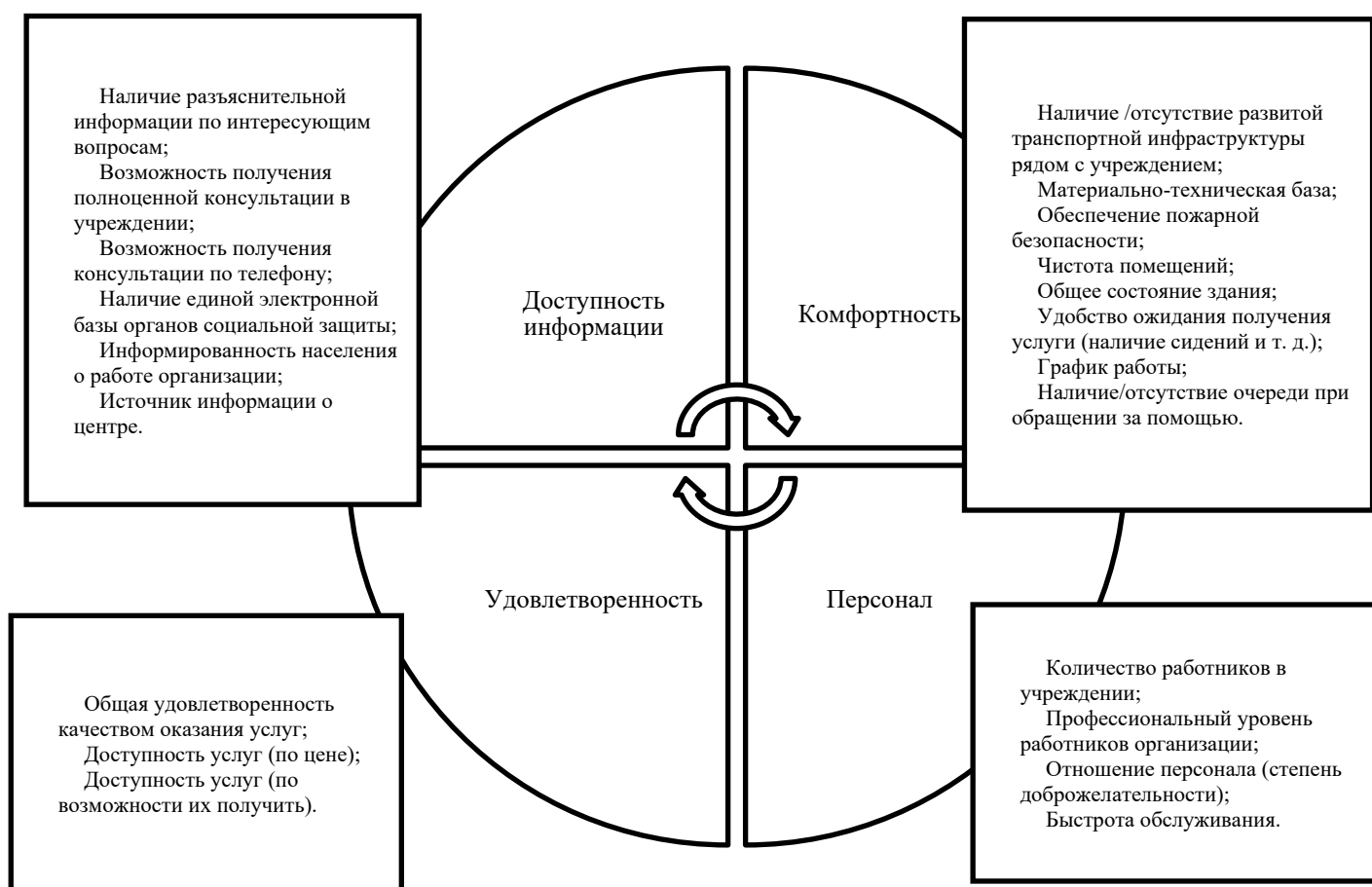
Рисунок 1. Оценка качественно-количественных характеристик деятельности учреждений социальной защиты населения