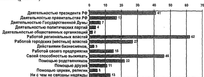
Рис. 2. С чем связывают жители Хабаровского края надежды на улучшение своего положения

Активному участию населения в решении вопросов местной жизни препятствуют, в первую очередь, неверие в возможность оказывать влияние на принятие решений, во вторую, индивидуализм, недостаток времени, безразличие к общим делам, в-третьих, низкое доверие к властям всех уровней, привычка надеяться на «все готовое». Так, более половины жителей края свои надежды на улучшение жизни связывают с работой правительства края, каждый четвертый надеется на местные органы самоуправления, на профсоюзы надежды возлагают только 2 % жителей (рис. 2).