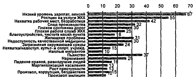
Рис. 1. Проблемы, наиболее беспокоящие жителей Хабаровского края

Социальное партнёрство как наиболее цивилизованный метод поиска сторонами оптимального баланса реализации своих интересов, причем не только в социально-трудовых отношениях, но и в решении общегражданских проблем (рис. 1), позволяет, реализуя меры, направленные на повышение качества жизни людей, снизить риск конфликтного развития общественно-политических процессов, обеспечить социальный мир и стабильность.