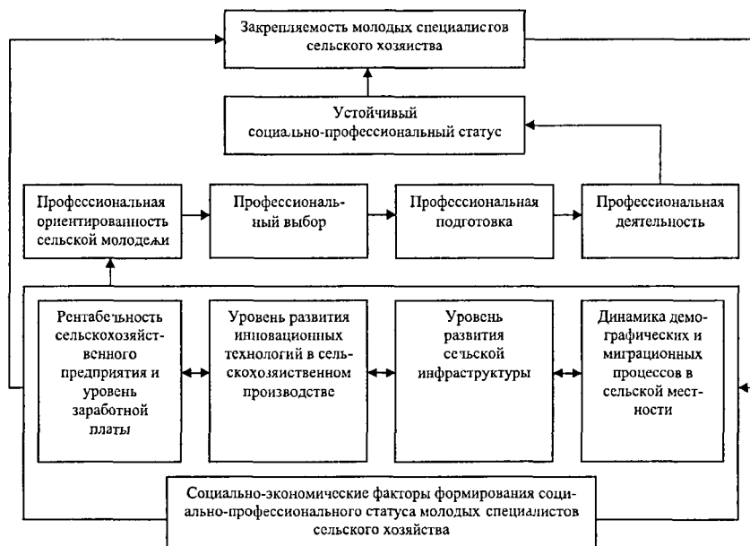
Комплексная модель формирования социально-профессионального статуса молодых специалистов сельского хозяйства

Проведенный анализ категорий «профессиональная социализация» и «молодой специалист сельского хозяйства» позволил нам разработать комплексную модель формирования социально-профессионального статуса молодых специалистов сельского хозяйства на региональном уровне (рисунок)