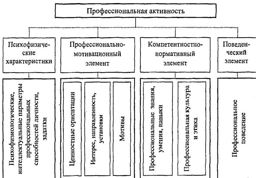
Рис 1. Структура профессиональной активности студента

Представляется, что уровень профессиональной активности студентов (высокий, средний, низкий) характеризуется целостностью ее структуры, а также развитостью и функциональной значимостью каждого из четырех структурных элементов.