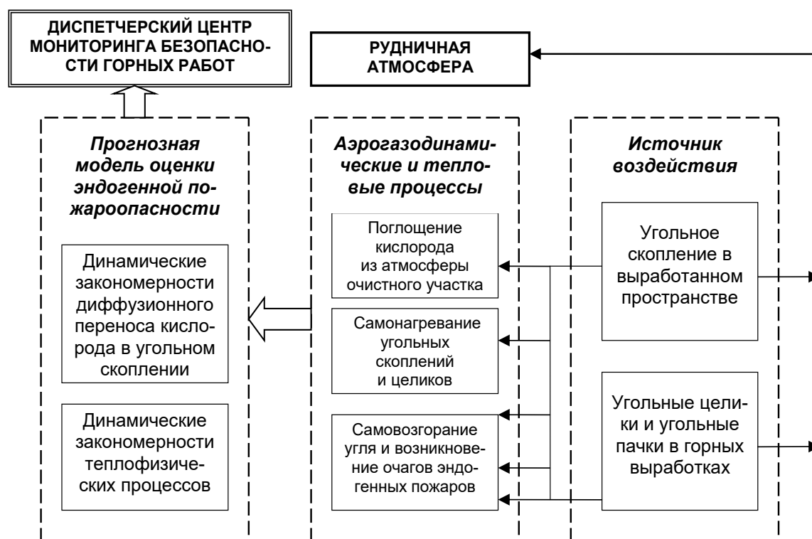
Рисунок 2 - Структурно-функциональная схема подсистемы оценки категории опасности по фактору самовозгорания угля на очистных участках

По результатам вычислительного эксперимента определяют время достижения максимальной температуры угольного слоя в выработанном пространстве и если эта температура менее 1 года, то категория пожароопасности – A , а степень пожароопасности – «Чрезвычайно опасно». Если же время достижения максимальной температуры угольного слоя в выработанном пространстве от 1 года до 5 лет, то категория пожароопасности – B , а степень пожароопасности – «Опасно». Если время достижения максимальной температуры угольного слоя в выработанном пространстве более 5 лет, то категория пожароопасности – C , а степень пожароопасности – «Неопасно».