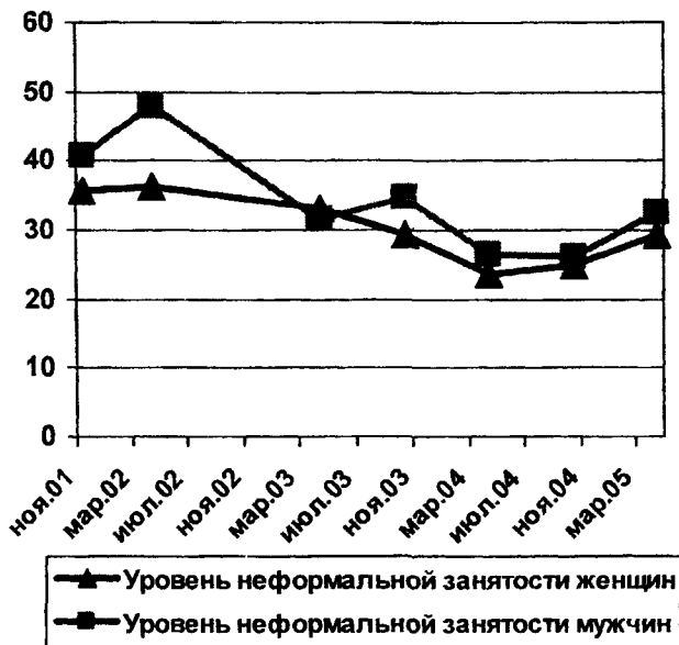
Рис. 2. Динамика уровня неформальной занятости в гендерном измерении

Участие женщин и мужчин в неформальной занятости, как показал анализ данных республиканского социологического мониторинга Татарстанстата в 2005 году, имеет не только сходство, но и существенные различия. Женская неформальная занятость в регионе как совокупность социальных практик распространена в наименее доходных сферах: в торговле товарами с подсобного хозяйства в рамках самозанятости и торговли продуктами и непродовольственными товарами по найму. Для мужчин больше характерна неформальная занятость в более доходной сфере строительства и ремонта жилья, частного извоза и перевозки грузов, ремонта бытовой техники и автомобилей. Женщины и мужчины практически в равной мере участвуют в неформальной занятости в таких сфе-