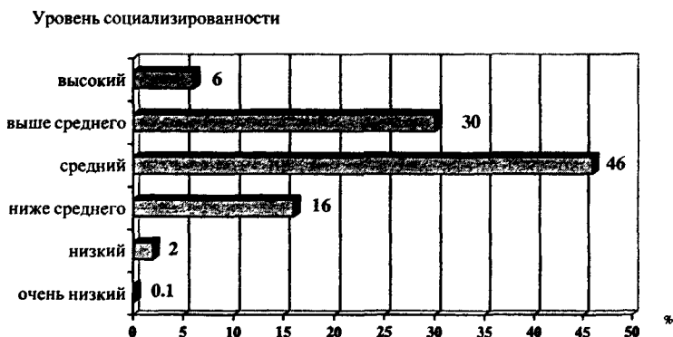
Рис. 3. Доля студентов - учащихся вузов Новосибирской области с разным уровнем социализированности (2003 г.), %

уровнем социализированности: высоким, выше среднего, средним, ниже среднего, низким и совсем низким (см. рис 3).