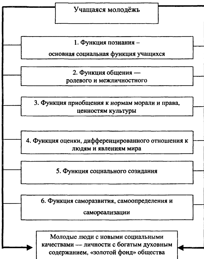
Рис. 2. Функциональное содержание социализации учащихся