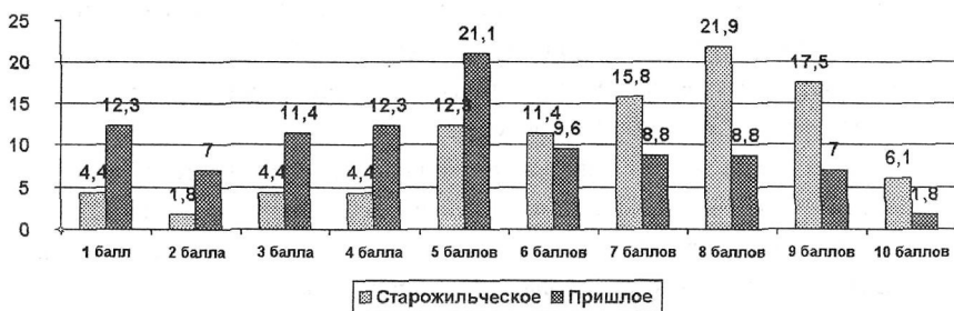
Рисунок 1 – Структурные особенности экспертных оценок степени влияния на целостность/прочность региона групп населения (10-балльная шкала), % (n = 432)

Качество жизни населения является одним из главных оснований социальной интеграции и складывается в зависимости от достигнутого уровня каждой из социальных отраслей народного хозяйства и сфер общественной жизни.