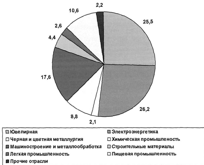
Рис. 1. Отрасли промышленности Смоленской области

В целом анализ трансформации территориально-отраслевой структуры хозяйства Смоленской области позволяет сделать вывод, что пока, к сожалению, нет оснований для роста и развития обрабатывающей промышленности. Незначительный рост в пищевой промышленности не может решать стратегических задач экономики региона. До сих пор отсутствуют значительные инвестиционные вложения в такие отрасли, как машиностроение, легкая промышленность и т.д. Внутренние же инвестиции предприятий не адекватны реальности.