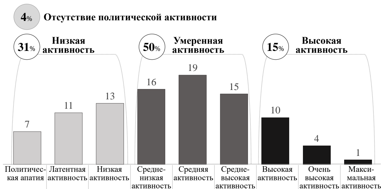
Рисунок 3 – Распределение респондентов по уровню политической активности, %

Как показано на рисунке 3, уровень политической активности молодежи России средний, но приближен к низкому; медианное значение индекса попадает в интервал средне-низкой активности.