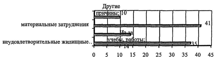
Рис. 1. Оценка причин, по которым откладывается рождение ребенка в молодых семьях

По результатам социологического исследования, проведенного в 2004г. среди жителей Приморского края на предмет выявления факторов, определяющих модель репродуктивного поведения, было установлено, что сложившаяся социально-экономическая ситуация ставит под угрозу самую главную функцию населения – репродуктивную 11 . Результаты данного исследования показали, что в Приморском крае все чаще происходит отказ от рождения вторых детей и задерживается воспроизводство первых по причине недостаточного материального положения молодоженов (рис. 1, 2).