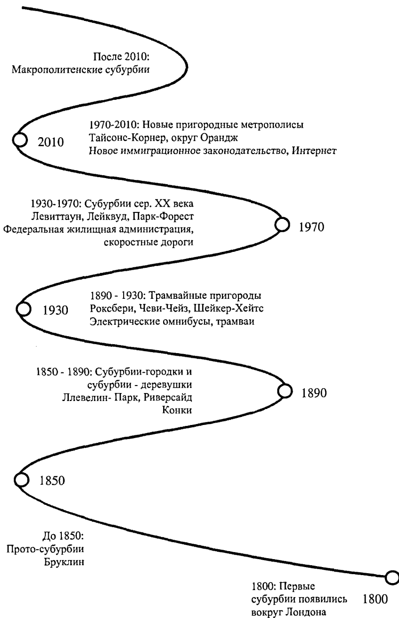
Рис. 1. Периоды субурбанизации в США.