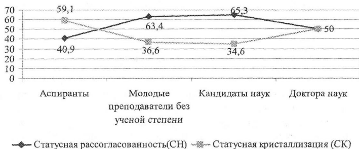
Рис. 1. Соотношение статусной рассогласованности и статусной кристаллизации в разных группах исследователей в зависимости от уровня образования (квалификации) и дохода, %

Диссертант отмечает, что характерной чертой социального положения молодых ученых является несоответствие (рассогласование) различных элементов статуса, таких как доход и уровень образования (при высоком образовательном уровне наблюдается снижение престижа и дохода) (рис. 1).