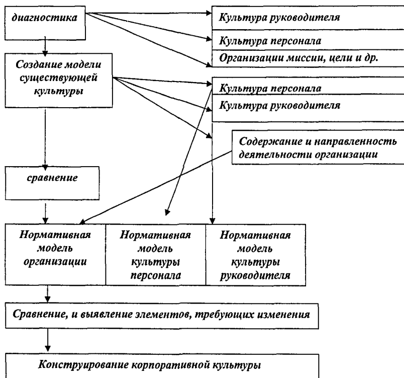
Рис.1 Социологическое обеспечение конструирования корпоративной культуры.

миссии, основных целей, причин существования предприятия, реальных, а не декларируемых ценностей, отношение к подчиненным; 2. диагностика культуры персонала, их представление о миссии, целях организации, их ценности, размышления о руководстве; 3. создание нормативной модели корпоративной культуры; 4. сравнение культуры руководителей, персонала друг с другом и с нормативной моделью; 5. выявление существенных отклонений культуры руководителей, персонала и организации от нормативной модели; 6. конструирование культуры руководителей, персонала, включающее в себя следующие этапы: формирование и накопление человеческого потенциала, его оптимизация, выработка культурных нормативов при помощи этического Кодекса, осуществление контроля за функционированием корпоративной культуры.