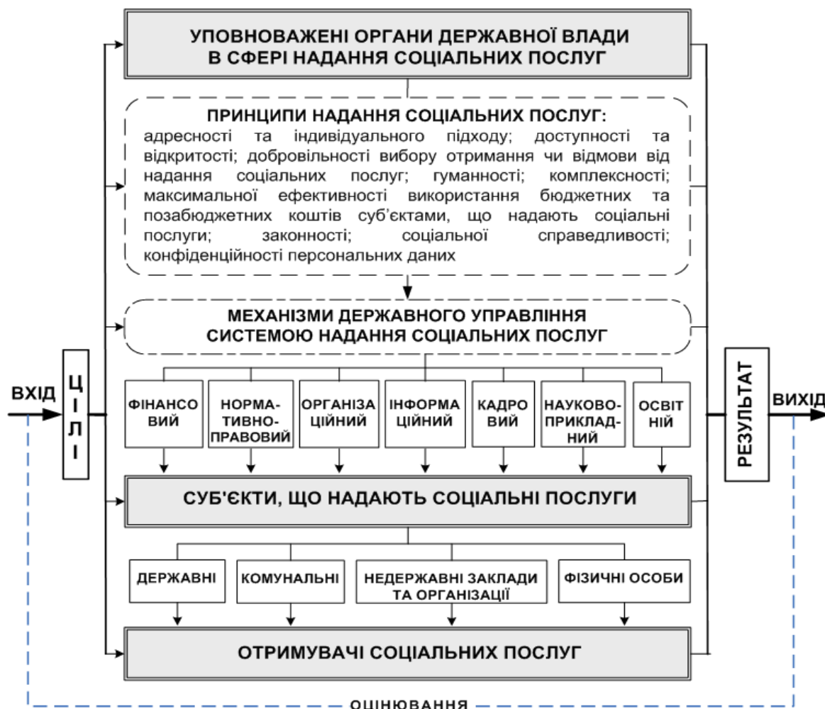
Рис. 1. Інтегральний механізм державного управління системою надання соціальних послуг

У процесі дослідження обґрунтовано потребу у висвітленні історичних передумов розвитку механізмів державного управління системою надання соціальних послуг, а також у тому, що систему надання соціальних послуг, механізми державного управління цією системою слід розглядати у взаємозв’язку подій минулого, сучасного та майбутнього. Підхід до дослідження, що базується на органічній єдності цих трьох складових, дає змогу виявити помилки, припущені в минулому, та запобігти їх виникненню у майбутньому, впровадити в державно-управлінську практику кращі історичний досвід і напрацювання. Пошук шляхів трансформування системи надання соціальних послуг, розроблення сучасних механізмів державного управління такими послугами мають базуватися на результатах дослідження історичних обставин, реалій, у яких вона колись функціонувала.