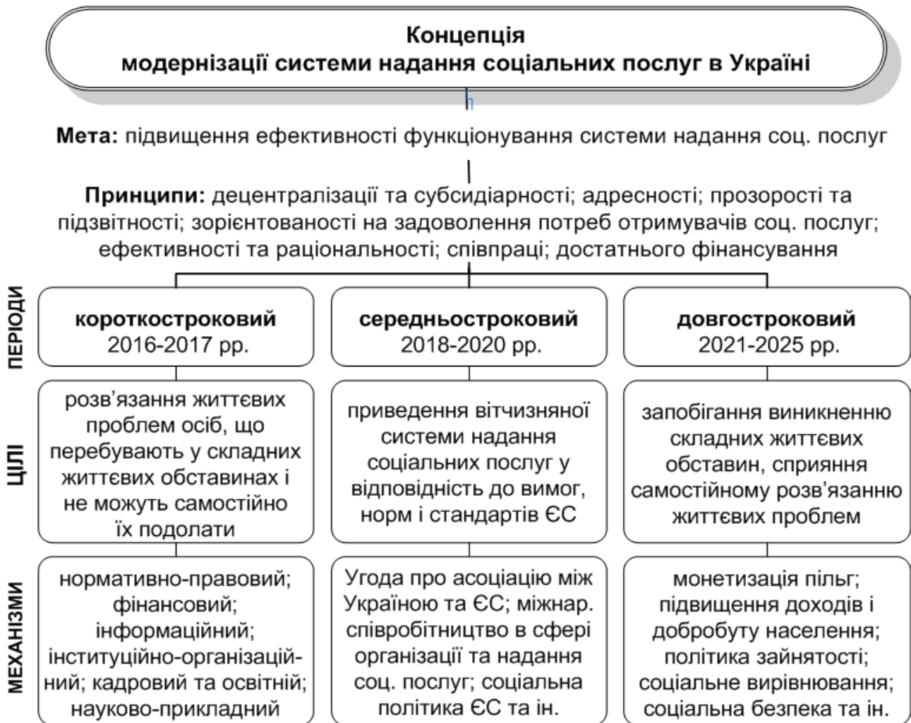
Рис. 3. Матриця Концепції модернізації системи надання соціальних послуг

Наголошено на тому, що основою вдосконалення механізмів державного управління системою надання соціальних послуг є Концепція модернізації системи надання соціальних послуг, яку розроблено з використанням результатів дослідження дисертації. До складу Концепції входять такі елементи (рис. 3): мета; принципи; періоди; цілі (пріоритети, завдання); державно-управлінські механізми.