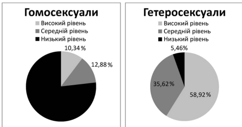
Рис. 2 Кількісні показники (%) рівнів психосоціального розвитку особистості юнацького віку з гомосексуальною та гетеросексуальною орієнтацією

Як видно з діаграми, серед досліджуваних гомосексуалів високий рівень психосоціального розвитку мають 10,34% респондентів, 12,88% – середній, 76,78% – низький. Переважаючим є низький рівень. Це означає, що для більшості гомосексуалів проблема психосоціального розвитку є актуальною, і такою, що викликає труднощі у сексуальній соціалізації. На відміну від гомосексуалів, у гетеросексуалів кількість осіб з високим рівнем психосоціального розвитку зростає до 58,92% респондентів, середнім до 35,62%, а з низьким зменшується до 5,46%. Переважаючим у гетеросексуалів є високий рівень психосоціального розвитку. Констатована різниця у показниках рівнів психосоціального розвитку у гомо- та гетеросексуальних респондентів вказує на те, що на розвиток «Я-концепції» та становлення сексуальної соціалізації впливає сексуальна орієнтація і ступінь інтегрованості сексуального Я в цілісний гармонійний образ себе.