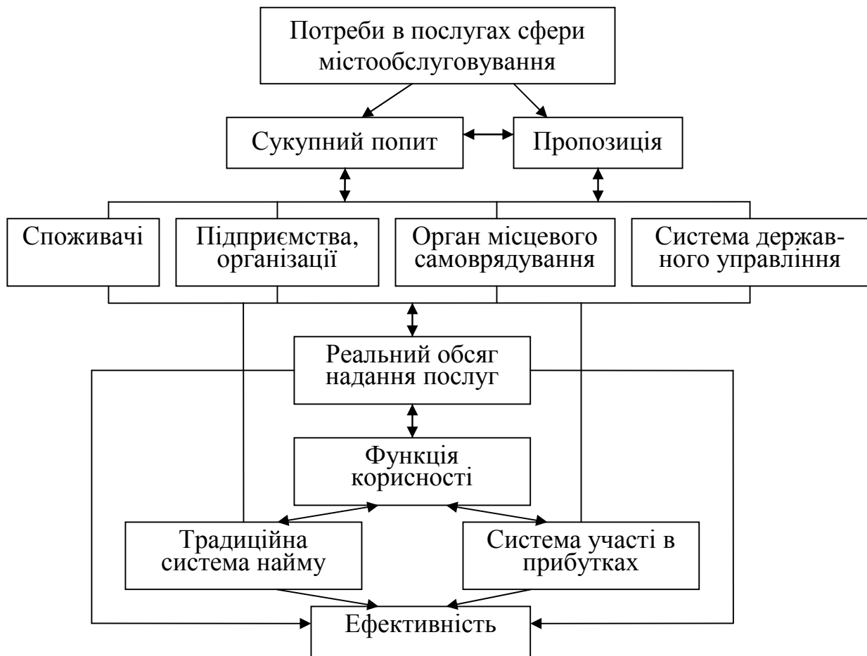
Рис. 3. Структурна схема моделі реалізації функції мотивації персоналу на підприємствах та в організаціях сфери містообслуговування

організацій сфери містообслуговування; ТГ, яка споживає продукцію; системи державного управління, яка здійснює регулювання економічних відносин, та ОМС – замовника і організатора надання послуг для ТГ (рис. 3).