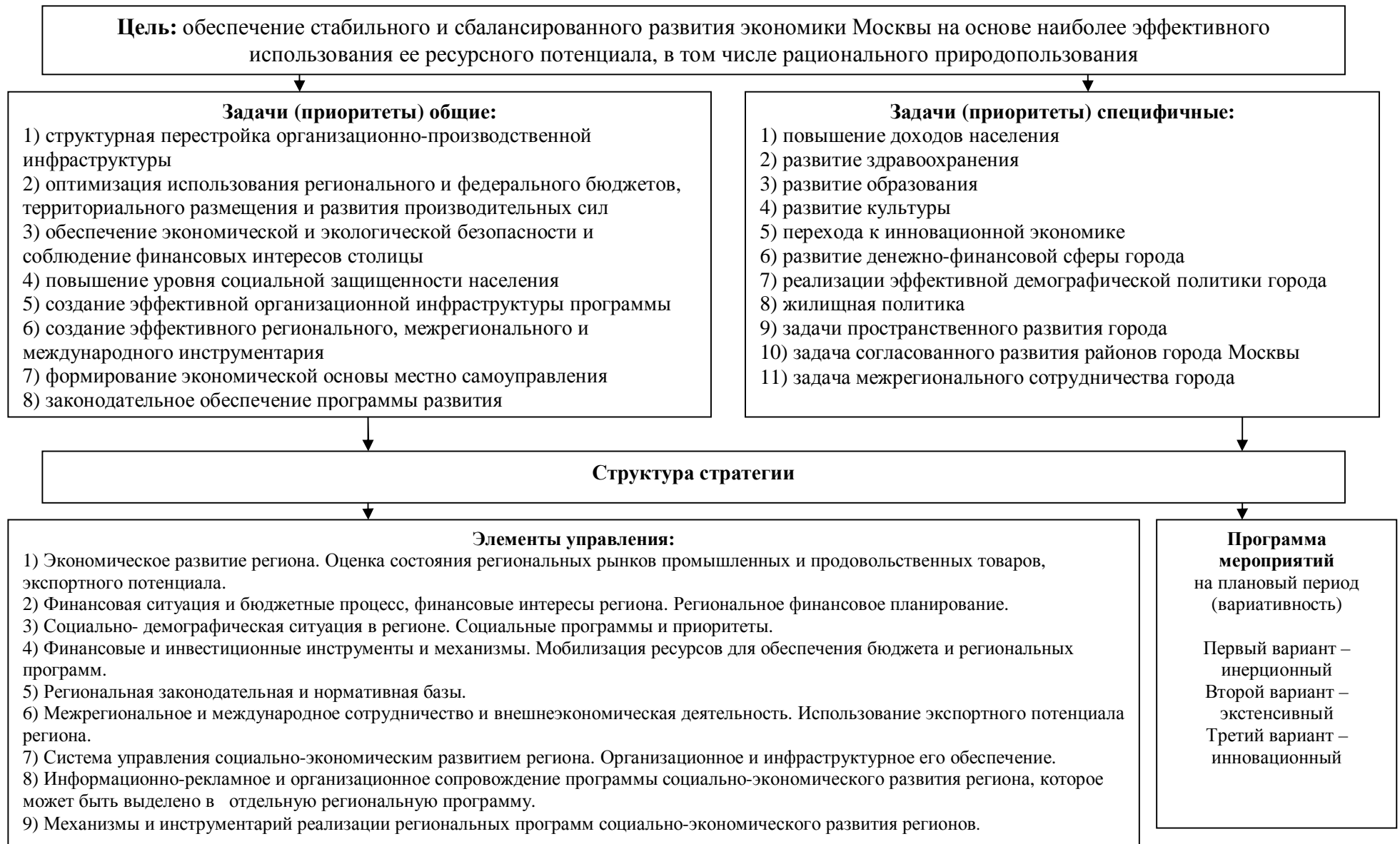
Рис. 2. Модели стратегии социально- экономического развития г. Москвы