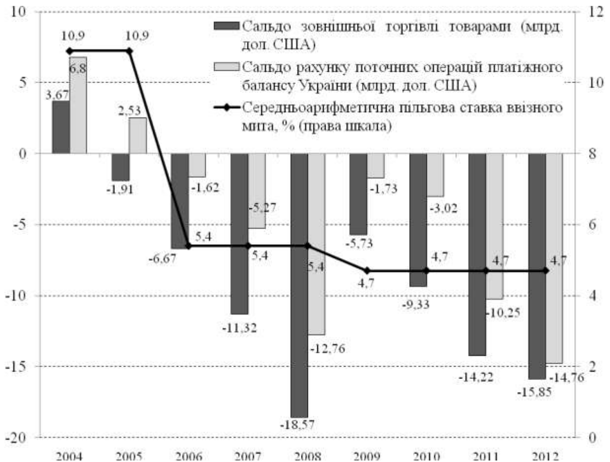
Рис.1. Динаміка окремих зовнішньоекономічних показників України

Як наслідок, темпи падіння українського експорту і ВВП у 2009 р. перевищили у 3,6 та 6,1 разів середньосвітові показники, платіжний баланс стрімко погіршився, а ряд галузей: харчова, легка, хімічна промисловість, нафтопереробка, машинобудування та інші внаслідок посилення зовнішньої конкуренції нині перебувають у кризовому стані. Більше того, навіть посткризова динаміка ключових зовнішньоекономічних показників не є сприятливою у рамках сталого економічного розвитку й має негативне перспективне спрямування (рис.1).