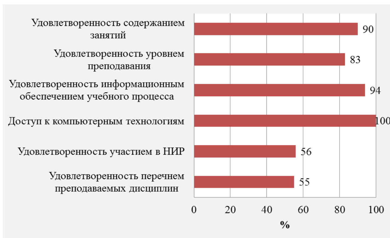
Рисунок 1 – Показатели удовлетворенности учебным процессом студентов факультета рекреации и туризма Высшей школы гостиничного дела и туризма (%)

1. В целом студенты удовлетворены своим обучением на факультете в Ченстохове (рис. 1).